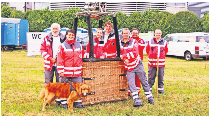
Mitglieder der BRK Bereitschaft Bayreuth I bei der Absicherung des „Ballonglühens“ in Forkendorf, Gesees.