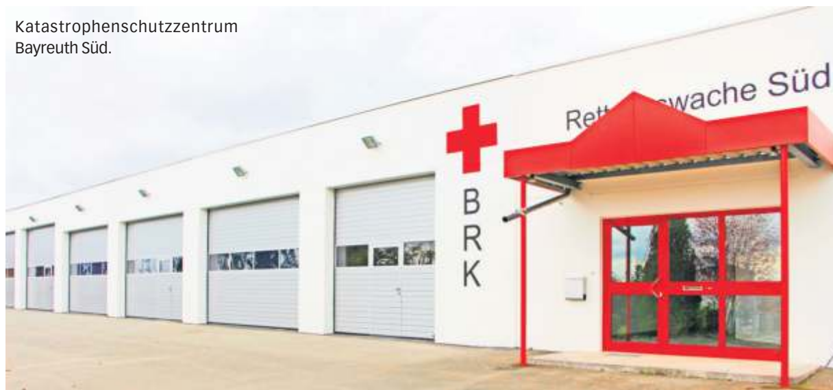
Katastrophenschutzzentrum Bayreuth Süd.