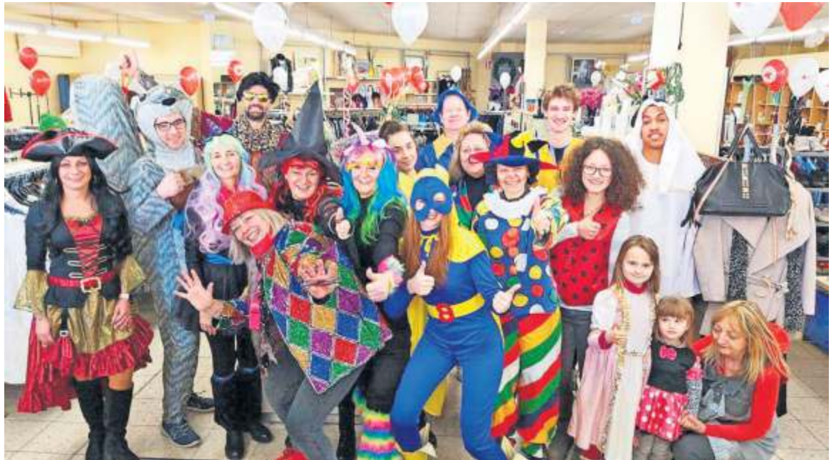
Faschingsparty 2019 im RotKreuz-Laden.

Eine gute Tat leisten Sie auch, wenn Sie uns auf einem unserer Kleider-, Haushaltwaren- oder Bücherflohmärkte besuchen und hier ein Schnäppchen erwerben! Aber auch durch die Abgabe gebrauchter, gut erhaltener Kleidung und Sachspenden können Sie die Arbeit des