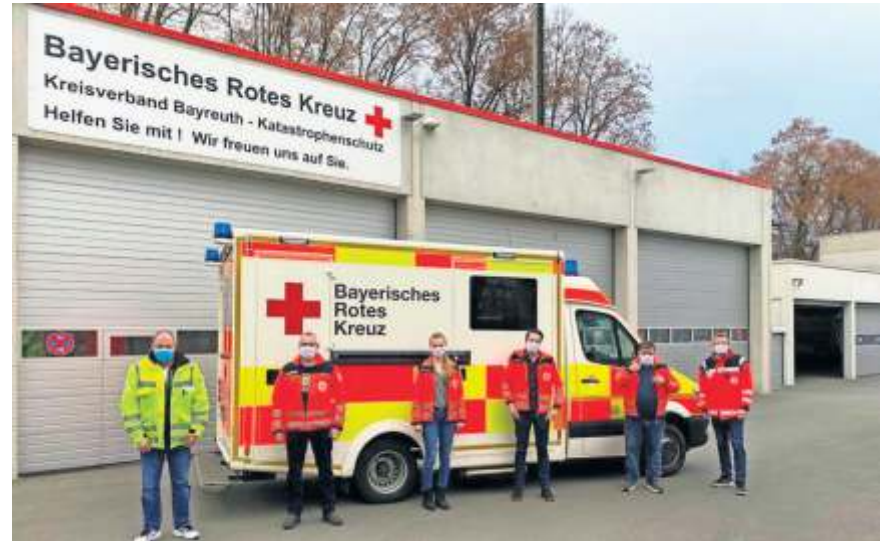
Ernennung neuer Wachleiter und Praxisanleiter im BRK Rettungsdienst Bayreuth.

Für die Erfüllung dieser Aufgabe unterhält der BRK Kreisverband Bayreuth Rettungswachen und Stellplätze in Bad Berneck, Bayreuth, Fichtelberg, Hollfeld, Pegnitz, Streitau (Gefrees) und stellt die HEMS-TC (Helicopter Emergency Medical Services – Technical Crew Member) des in Bayreuth stationierten Rettungshubschraubers Christoph 20 der ADAC-Luftrettung. Darüber hinaus stellt der der Rot-Kreuz-Rettungsdienst Bayreuth auch den Fahrer für das Notarzteinsetzfahrzeug, welches im Wechsel mit Ärzten der ansässigen Kliniken und Gesundheitszentren 365 Tage im Jahr, rund um die Uhr, besetzt ist. Unterstützt wer-