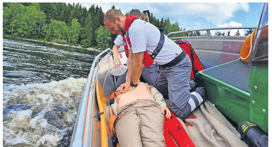
Wasser- und Landrettung trainieren gemeinsam – kombinierte Übung der Wasserwacht und der Bereitschaften.