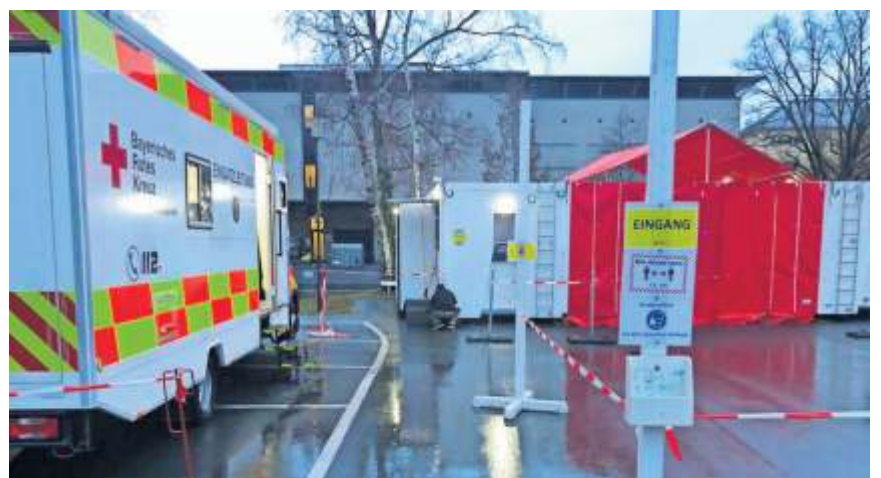
Zur Entlastung des Personals der Pflegeeinrichtungen eingerichtete Teststation am BRK Ruhesitz.