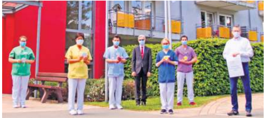
Kreisgeschäftsführung und Personalrat bedanken sich bei den Mitarbeitenden der Senioreneinrichtungen und des Pflegedienstes am internationalen Tag der Pflege.

Die Senioren- und Pflegeeinrichtungen waren 2020 besonders stark durch die Folgen der Corona-Pandemie gefordert. Um die Bewohnerinnen und Bewohner so gut wie möglich vor Ansteckungsgefahren zu schützen, mussten strenge Infektionsschutzmaßnahmen umgesetzt und Testungen bei Personal und Besuchern durchgeführt werden. Der daraus resultierende Aufwand führt zu einer Mehrbelastung der Mitarbeiterinnen und Mitarbeiter. Trotz dieser nicht unerheblichen Anforderungen, stand für das Personal der Pflege- und Senioreneinrichtungen des Roten Kreuzes das Wohl der Bewohnerinnen und Bewohner stets im Fokus. Mit gro-