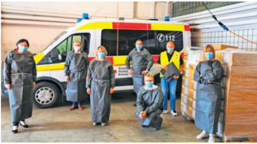
Bayreuther Wohlfahrtsverbände arbeiten zusammen bei der Beschaffung von Schutzausrüstung.