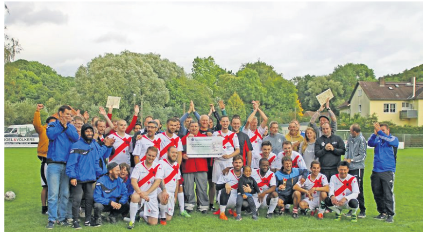
Die Mannschaft der Senioreneinrichtungen des Roten Kreuzes Bayreuth beim Benefiz-Kicker-Turnier zu Gunsten des Herzenswunsche Hospizmobils.