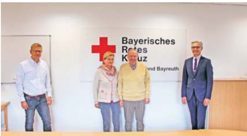
Großzügige Unterstützung des Roten Kreuzes in Bayreuth durch die Gisela-und-Jörg-Schön-Stiftung.