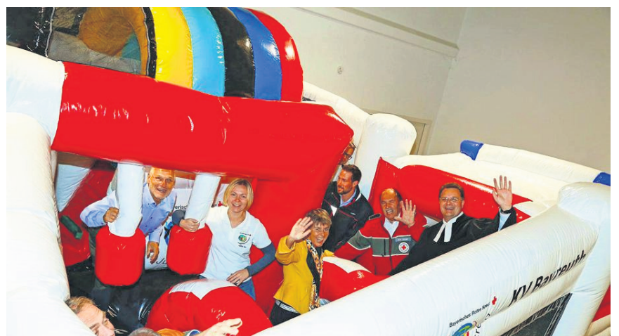
Weihung der JRK Hüpfburg inklusive „Testlauf“ mit den Ehrengästen.