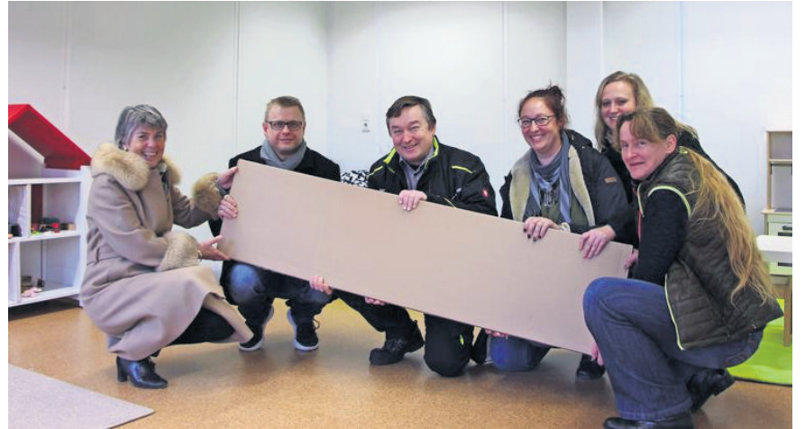
Eröffnung des Kindernests im Januar 2020 mit damaliger Oberbürgermeisterin Brigitte Merk-Erbe.

Ein rasches Umdenken aller Beteiligten wurde notwendig, um den Betrieb der BRK-Kinderbetreuungseinrichtungen weiterhin strukturiert und dennoch sicher aufrechtzuerhalten. So wurden weitere Laptops angeschafft, um die Kommunikation untereinander über Online-Treffen sicherzustellen und Homeoffice zu ermöglichen. Auch die jährliche Elternbefragung fand online statt. Die zu Hause Gebliebenen wurden durch beide Teams mit lustigen Videos, Briefen und kleinen Geschenken bedacht.