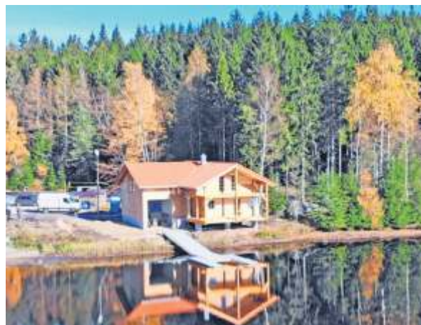
Wasserrettungsstation am Fichtelsee.

Lange Anfahrtswege und die begrenzte Anzahl der öffentlich-rechtlichen Rettungswagen stellen besonders im ländlichen Raum die rechtzeitige, notfallmedizinische Versorgung notleidender Patienten oftmals auf eine harte Bewährungsprobe. Mit den Helfern-Vor-Ort unterstützt das Rote Kreuz im Landkreis Bayreuth den öffentlich-rechtlichen Rettungsdienst mit und sorgt für gerade im ländlichen Raum für eine schnelle Erstbetreuung und eine Verkürzung des behandlungsfreien Intervalls bis zum Eintreffen des Rettungsdienstes. Helfer-vor-Ort des BRK Kreisverbandes Bayreuth sind in Aufseß, Creußen, Gefrees, Hollfeld, Mistelgau, Pegnitz, Weidenberg und im Hohen Fichtelgebirge im Einsatz.