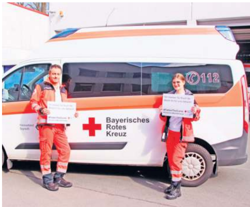
Wir bleiben für Euch da – Bleibt Ihr für uns daheim! – Slogan aus dem Frühjahr 2020.

Aber auch allen anderen Bereichen standen vor pandemie-bedingten Herausforderungen. Im Rot-Kreuz-Menüservice Essen-auf-Rädern