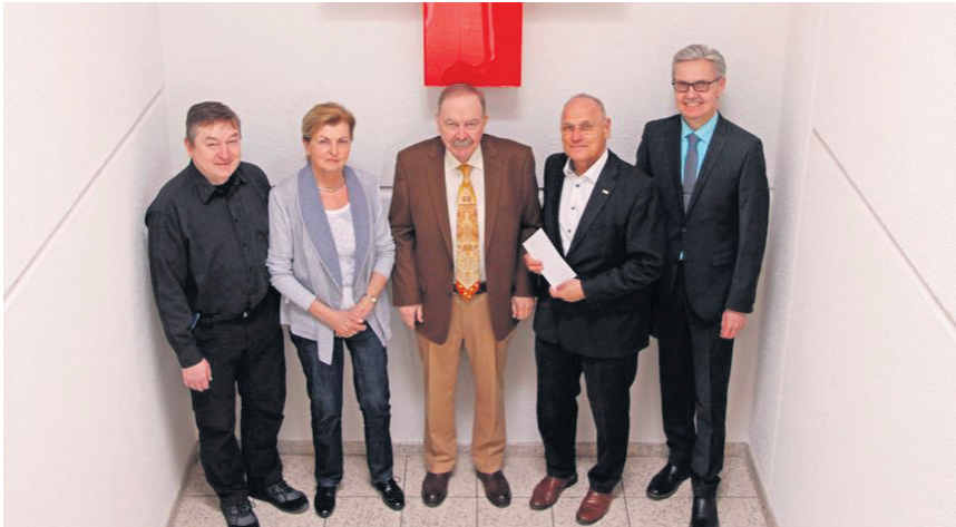
Großzügige Unterstützung des Roten Kreuzes in Bayreuth durch die Gisela und Jörg Schön-Stiftung.