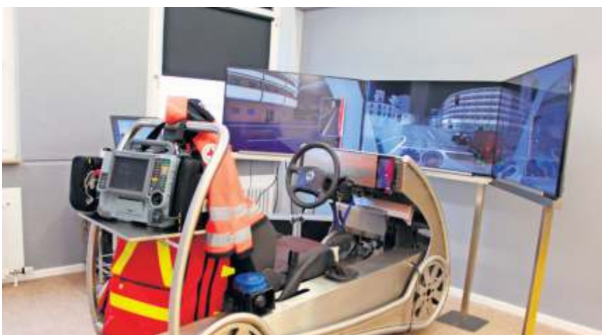
Sicherheit durch Innovation – RTW-Fahrsimulator der Bayreuther Notfallsanitäterschule.