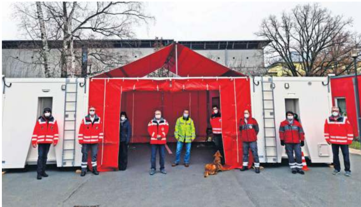
Mobiles Notfall Versorgungszentrum.

Mit dem MNVZ konnte ein innovatives, hochmobiles, bayernweit einzigartiges Einsatzmittel für geschaffen werden, dass für eine Vielzahl von Einsatzszenarios vielfältige Funktionen ausführen kann. Es besteht aus zwei modularisierten und eigens geplant und angefertigten Abroll-Container und einem 2019 ergänzten Wechselladerfahrzeug. Mit dem MNVZ lässt sich mit geringem Personaleinsatz in kurzer Zeit, ein unabhängig operierendes