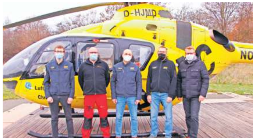
Personalwechsel bei den TC HEMS.