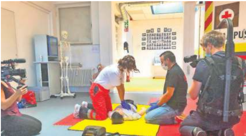
Dreharbeiten für das Arte-Wissensmagazin Xenius in der Notfallsanitäterschule in Bayreuth.