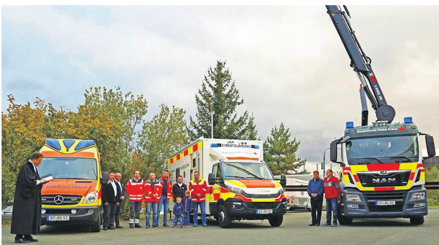
Weihung der Einsatzfahrzeuge im Katastrophenschutzzentrum Bayreuth-Süd (Hospizmobil, ELW und WLF).